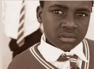
Dankzij het project Sipho Esigle krijgen aidswezen schooluniformen en schoolgeld.