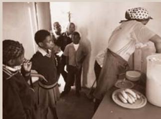
Kookmoeders delen voedsel uit aan weeskinderen in township Rethabiseng.