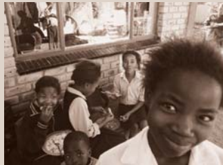
Jonge meisjes die zijn vaak gevoelig voor sugardaddy's. Mannen die hen in ruil voor seks cadeautjes, geld of eten geven.