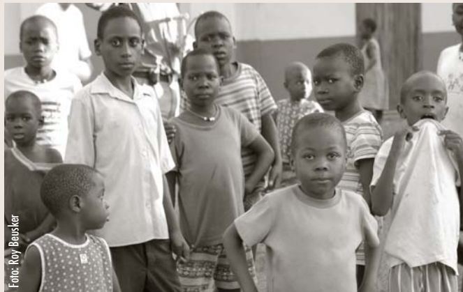
In Malawi sterven steeds meer kinderen onder de vijf jaar

Zuidelijk Afrika lijdt zwaar onder de aidscrisis. De epidemie remt de ontwikkeling van de gehele samenleving af. Zo is in Malawi, een land met meer dan tien miljoen inwoners, ruim zestien procent van de volwassenen geïnfecteerd met hiv. De gemiddelde levensverwachting is gedaald naar veertig jaar en dat zal nog verder naar beneden gaan. Ook kinderen onder de vijf jaar sterven steeds vaker aan aids.