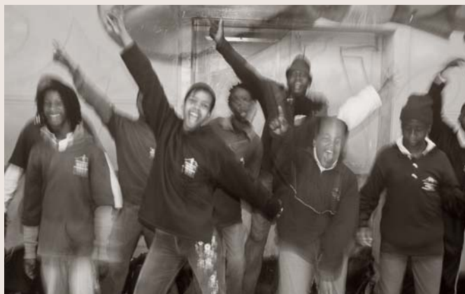
Ngaari Laaw gebruikt muziek om jongeren te bereiken

Muziek is van alle tijden en van alle generaties. Daarom is muziek ook zo geschikt om grote groepen mensen te bereiken. In Senegal zingt de groep Ngaari Laaw over hiv en aids. Zo willen ze taboes doorbreken en het onderwerp bespreekbaar maken.