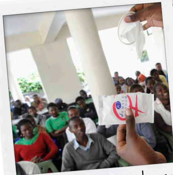
Een vrouwencondoom laten zien