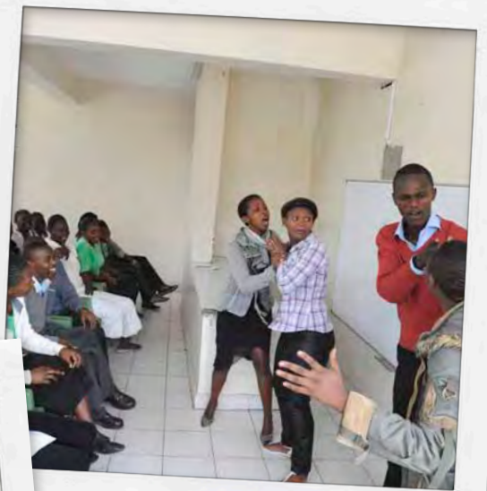
Voorlichting d.m.v. rollenspel

Het Senga-model is een preventiemethode waarbij gebruik wordt gemaakt van de traditionele rol van tantes bij het voorlichten van jonge meisjes over seks, het huwelijk en andere zaken waar je als volwassen vrouw mee te maken krijgt. De tantes laten ook zien hoe je seks lekker kunt maken. Als er geen tantes voorhanden zijn om deze rol op zich te nemen, dan kunnen meisjes terecht bij commerciële senga's. In Oeganda zijn projecten opgezet waarbij de senga-traditie gebruikt wordt om meisjes te leren hoe ze hiv-overdracht kunnen voorkomen. Tantes leren meisjes hoe ze op een veilige manier meer plezier kunnen beleven aan seks.